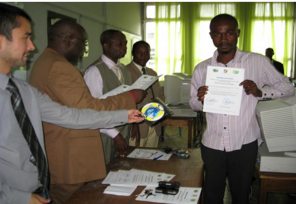
Some formalism at the end of the training in RDC (Kinshasa)