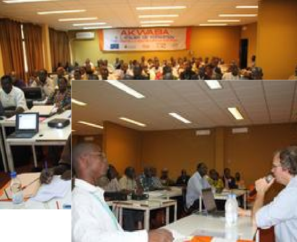
A very large group in Ivory Coast (Yamoussoukro)