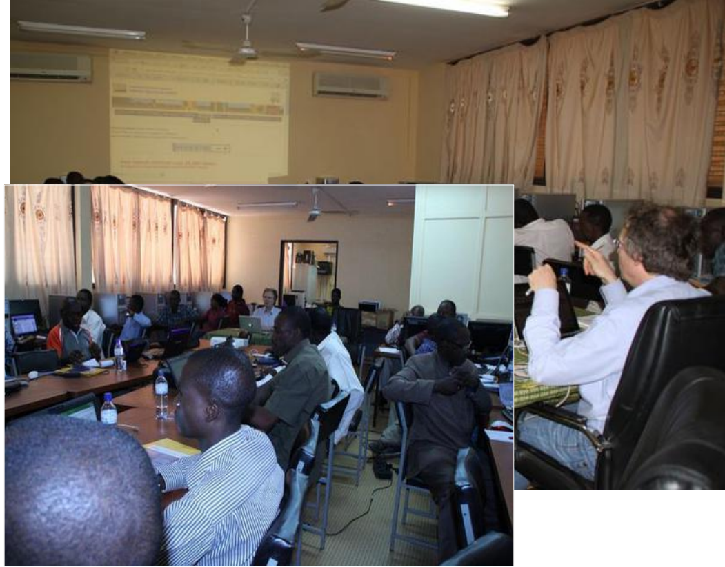
20 PhD students in Burkina Fasso (Ouagadougou)